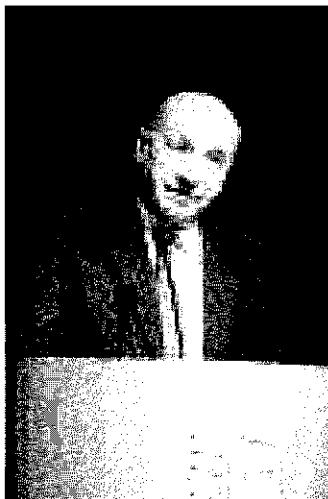
Il presidente Carlo Alberto Roncarati

crescere ancor di più l'effetto le-va complessivo di tale, importante sistema di garanzia aggiuntiva. L'iniziativa si sviluppa con il pieno coinvolgimento dei Confidi, che per l'esperienza e la vicinanza alle imprese sono in grado di offrire un adeguato supporto al sistema bancario nel processo di erogazione dei finanziamenti. Il sistema bancario assicurerà poi finanziamenti a tassi e condizioni di favore. Le garanzie del fondo si aggiungono a quelle già offerte dai Confidi, portando, in alcuni casi, fino all'80% la copertura dei rischi di insolvenza. I contemporanei e positivi interventi della Regione, di Unioncamere Emilia-Romagna e di ABI, in piena logica di sinergia e complementarietà, aumenteranno gli effetti moltiplicatori del sistema di contro garanzia.