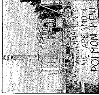
Inceneritore, braccio di ferro A PAGINA 14