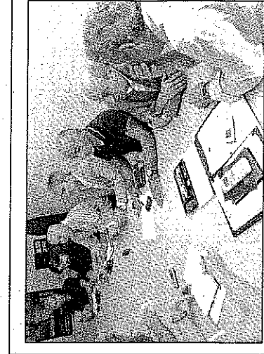
I vertici di Ds e Margherita all'incontro di ieri