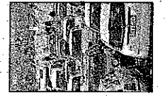
Nuovi posti? A PAGINA 9

FERRARA. Di nuovi parcheggi sono pieni gli accorposti in questi anni, ma visti. Ora sette interventi sui parcheggi sono dentro il Programma d'area che porta dietro soldi regionali. Si va dal multipiano al Mof al bunker di piazzale Bruno.