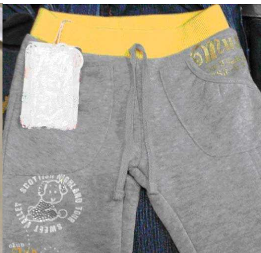
Non conforme alla Norma Europea UNI EN 14682, punto 3.4.2